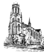
Herz Jesu (H) Danzierstr.