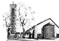
St. Elisabeth (EI) Elisabeth-Breuer-Str.