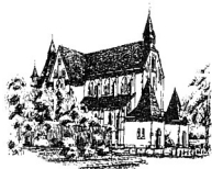
St. Antonius (A) Tiefentalstr.