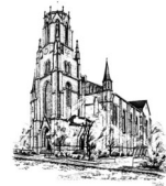
Herz Jesu (H) Danzierstr.