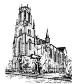
Herz Jesu (H) Danzierstr.