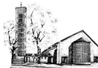
St. Elisabeth (EI) Elisabeth-Breuer-Str.