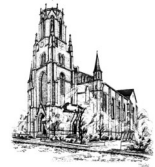
Herz Jesu (H) Danzierstr.