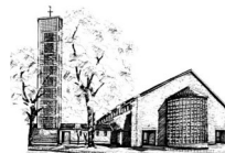
St. Elisabeth (EI) Elisabeth-Breuer-Str.