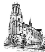
Herz Jesu (H) Danzierstr.