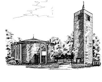
St. Theresia ( Th ) An St. Theresia