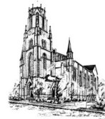
Herz Jesu (H) Danzierstr.