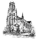
Herz Jesu (H) Danzierstr.