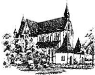
St. Antonius (A) Tiefentalstr.