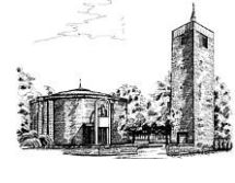
St. Theresia (Th) An St. Theresia