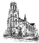
Herz Jesu (H) Danzierstr.